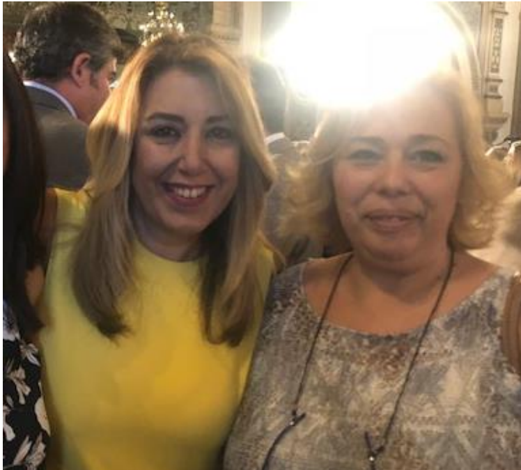
Presidenta Junta Andalucía

LA PRESIDENTA DE LA JUNTA PRESENTÓ EL FORÚM EUROPA TRIBUNA ANDALUCÍA CON LA ALCALDESA DE CÓRDOBA.