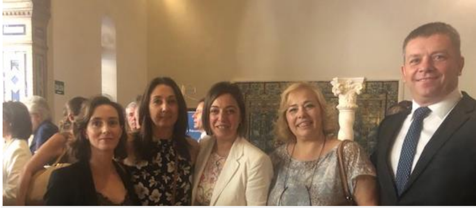
Personal Tec. Asemeco junto a Isabel Ambrosio, Alcaldesa de Córdoba.